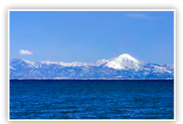
「湖岸からの絶景」琵琶湖岸から対岸の冠雪した伊吹山がきれいに見えました。写真で冬景色を楽しむのいいね♪(たかP)