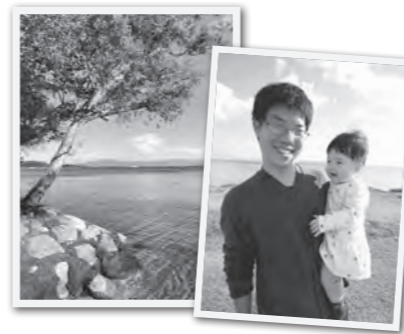
自然を感じる 高島ですくすく 成長中！

高島には道の駅もあって、買い物などの日常生活には困りません。こんなに便利なのに、リゾート気分を味わえる琵琶湖畔や、自然を楽しむ山にすぐ行ける立地です。