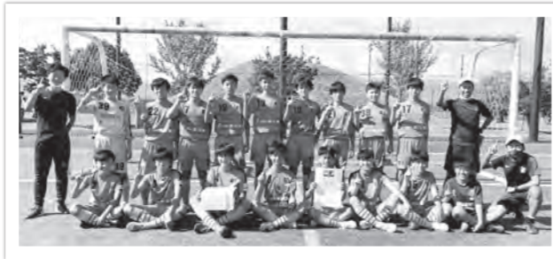
市内の関西大会出場選手