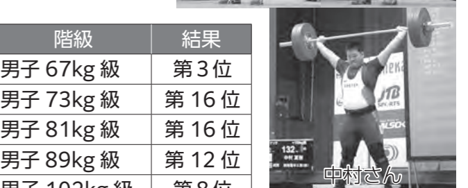
レディースカップ第14回全日本女子選抜ウエイトリフティング選手権大会 (敬称略)