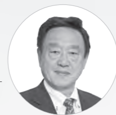
議長 廣本 昌久

新年の門出にあたり、市民の皆さまのご健勝とご多幸を心からご祈念申し上げます、年頭のごあいさつとさせていただきます。