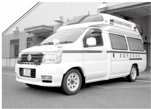
車両の両側面上部前後には、LED作業灯を新しく装備。

北部消防署朽木分遣所に配置している救急車を、老朽化に伴い、過疎対策事業債を活用し更新しました。新しい救急車は、搭載している心電計やAED、担架などの機材も新しくなっており、3月17日から運用しています。