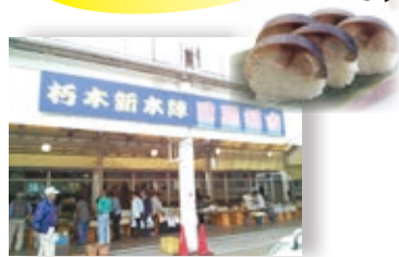
道の駅 くつき新本陣