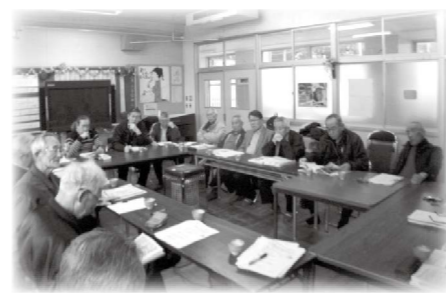
今津西小学校跡地利用会議風景