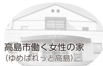
高島市働く女性の家 (ゆめばれっと高島)

男性と女性が、職場や学校、地域や家庭で、それぞれの個性と能力を発揮できる「男女共同参画社会」を実現するために、一人一人が取り組めることを考え、行動していきましょう。