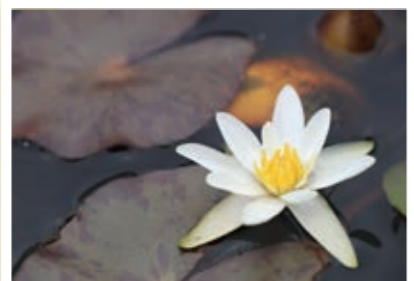
ヒツジグサは「水辺の妖精」が名前の由来みたい！

スマートフォンや携帯電話などからの応募も大歓迎！また、市ホームページではカラーで掲載！