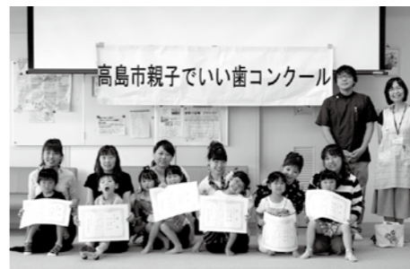
参加者全員でいい歯でニコリ

6月15日(木)、安曇川保健センターで「高島市親子でいい歯コンクール」を開催しました。これは、子どもの歯の健康管理を通して、家族の歯への意識を高めてもらうために開催しています。