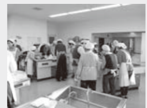
(主催：健康推進員・管理栄養士)