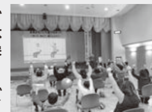
(主催：フィットネス浜分)