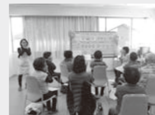
(主催：歯科医師・歯科衛生士)