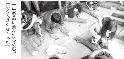
「一生懸命に菌を打ち込む。早く大きくなあれ」