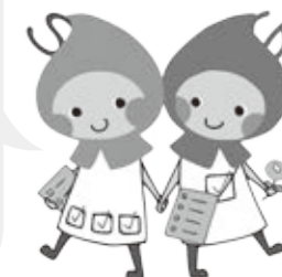
滋賀県健康づくりキャラクター ハグ&クミ