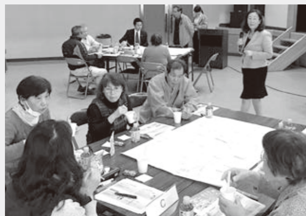
災害非常食の試食のようす

3月21日（水）に今津東コミュニティセンターで、防災講演会「女性の視点で防災を考える～自分を大切にする人を守るために～」を開催しました。この講演会では、災害のリスクや防災への女性参画の必要性、また、災害時における自助の重要性、取り分け災害時の備蓄にスポットを当てて講師の方にご講演をいただいた他、ワークショップなどを行いました。参加された方々は、熱心に受講され、いつやってくるかわからない災害に対して、ひとりひとりの防災意識が高まった講演会となりました。（防災課）