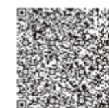
申し込みメール作成用 二次元コード

健診・がん検診の詳細については、「たかしま健康だより」をご覧ください。(ファックス申込用紙が付いています。メールでのお申込みは、右の二次元コードをご利用ください。)