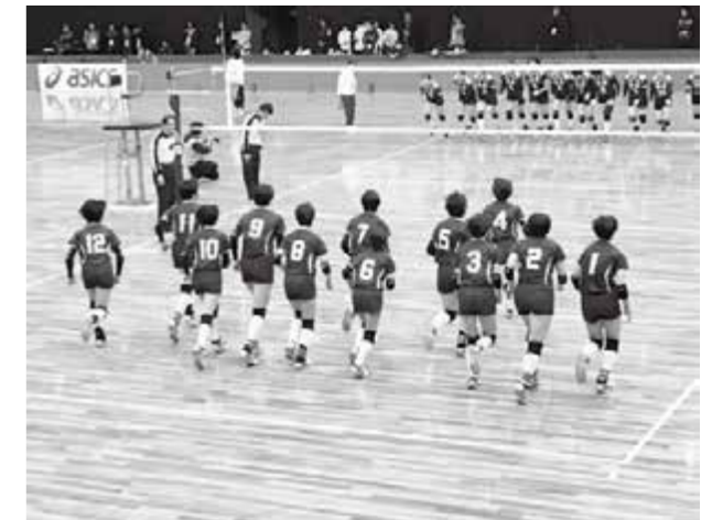
試合勝利後、あいさつに向かう選手たち