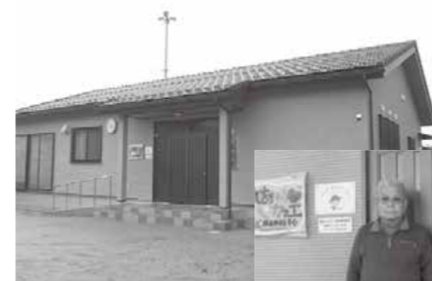
整備を行った集会所

一般財団法人自治総合センターが実施しているコミュニティ助成事業(宝くじ助成)を活用し、リバーサイド区自治会の集会所を整備しました。(市民協働課)