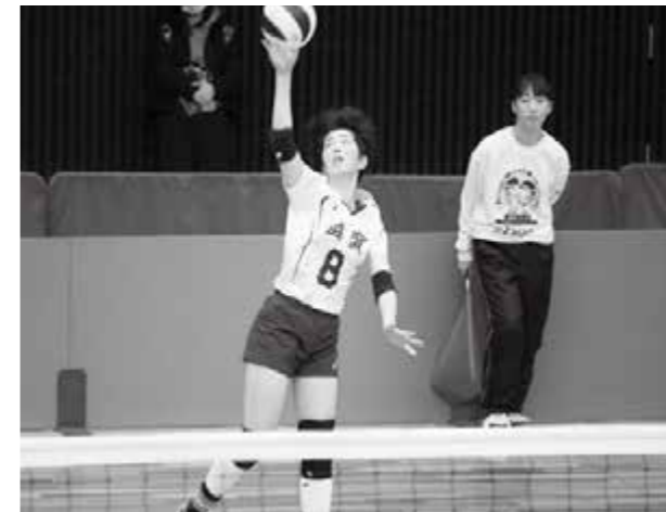
試合では主力選手として活躍しました!