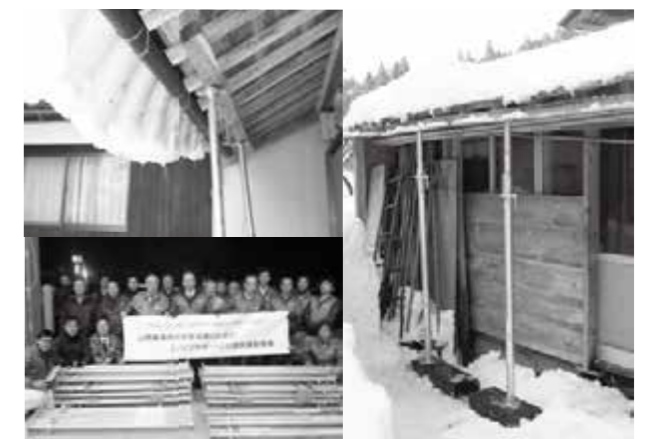
パイプサポートを設置した状態

山間部の暮らしをこのような形で、サポートいただけることは、大変ありがたいことです。(市民協働課)