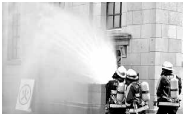
実際に消防職員が放水を行いました

資料館は、平成15年に国の登録有形文化財として登録され、防火意識を高めるために今回訓練場所となりました。訓練では区民の方に、火災が発生した時の一連の流れを体験していただき、また消防団・消防署による放水訓練も実施しました。地域の宝である文化財を守っていくため、文化財防火運動へのご理解とご協力をお願いします。(文化財課)