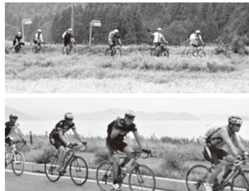
田園風景や湖岸を楽しみながら走る