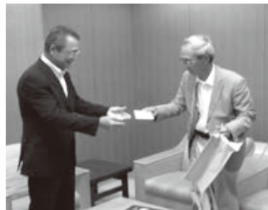
ペトスキー市長からの手紙を贈呈

来年は、ペトスキー市の方が高島市を訪問される予定です。お互いの生活や文化についての理解が深まるよう交流を続けていきます。(観光振興課)