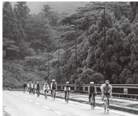
雨が降っても大丈夫!