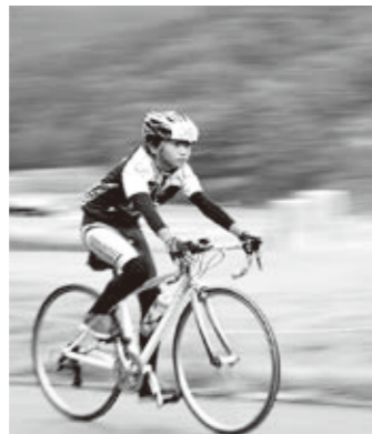
自然の中を駆け抜ける