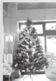
園子ども家庭相談課 ☎ (25) 8517

オレンジリボンには「子ども虐待防止」というメッセージが込められています。11月1日（木）から、市役所新館正面玄関ロビーにオレンジリボンツリーを設置します。来庁の際には、オレンジ色のメッセージカードやリボンを飾りつけていただき、オレンジリボンツリーの完成にぜひご協力をお願いします。