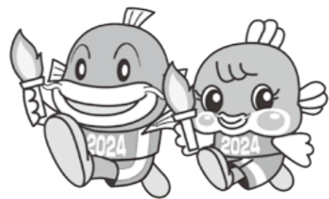
2024滋賀国体・全国障害者スポーツ大会マスコットキャラクター

この大会の機運を高めるため、広く県民に愛され、滋賀の魅力を県内外に発信できる大会の「愛称」と「スローガン」および、より多くの方々への周知を図る取り組みとして、モザイクアートポスター制作にかかる写真を募集します。詳しくは、滋賀県庁のホームページをご覧ください。下記までお問い合わせください。 ※2023年1月1日から「国民体育大会」は「国民スポーツ大会」に名称が変更されます。