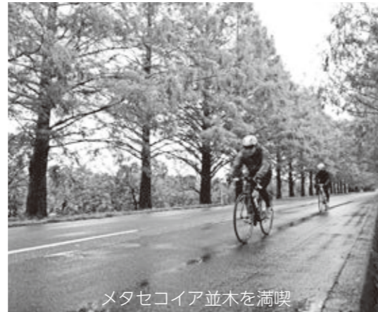
メタセコイア並木を満喫

全国から集まった約600人のサイクリストたちは、高島市の自然豊かな景色とエイドステーションで振舞われた地元ならではの味覚を堪能しながら、市内約100kmを颯爽と駆け抜けました。実行委員の方々や中学生ボランティア、また地域の皆さんの協力により大雨にも関わらずイベントは大いに盛り上がりました。(観光振興課)