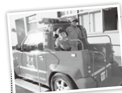
消防本部予防課 ☎(22) 5403

『忘れてない？ サイフにスマホに火の確認』 11月からは暖房器具などを使用する機会が増えるとともに、空気が乾燥し火災が発生しやすい時期です。火の取り扱いには十分注意してください。 防災体験ひろば2018 とき 11月11日 13時～16時 ところ 高島市消防本部 大人から子どもまで幅広く、防災意識を高めていただくためのイベントです。 ▼内容 ロープ渡り、放水、煙ハウス、ミニ消防車乗車体験などの体験コーナー、市内の小学生が描いた防火ポスター展、防災グッズなどの展示コーナーなど。 また、消防隊・救助隊の訓練展示も行いますので、皆さんのご来場をお待ちしています。