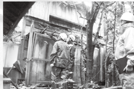
専門家と市職員による立入調査