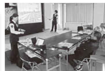
シミュレーターを使った危険予知体験の様子

市内で発生する交通事故の約40%が高齢者が関係する事故です。中でも一時不停止による出会い頭事故が特に多く、どれだけ気を付けていても予期せぬ事故に巻き込まれることもあります。そのような状況の中、セーフティーたかしま、交通安全推進協議会では、滋賀県警察本部に新たに導入された「出前型運転者危険予測トレーニング装置(KYT)」を使った高齢運転者事故防止講習を実施し、18人の方に参加いただきました。