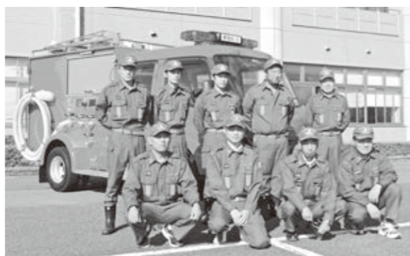
新しい車両の前で記念撮影

消防団を中核とした地域防災力の充実強化によって、皆さんの安全と安心を確保します。