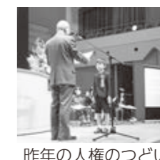
昨年の人権のつどい

12月4日～10日は人権週間です みんなで築こう 人権の世紀 考えよう相手の気持ち 未来へつなげよう違いを認め合おう