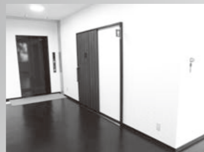
多目的トイレの設置