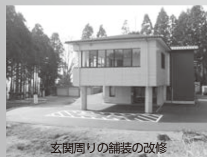
玄関周りの舗装の改修

また、待合室、空調設備、玄関周りの舗装などの改修を行い、利便性の向上を図りました。