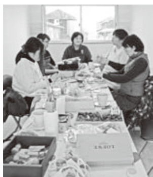
みんなでワイワイ小物作り