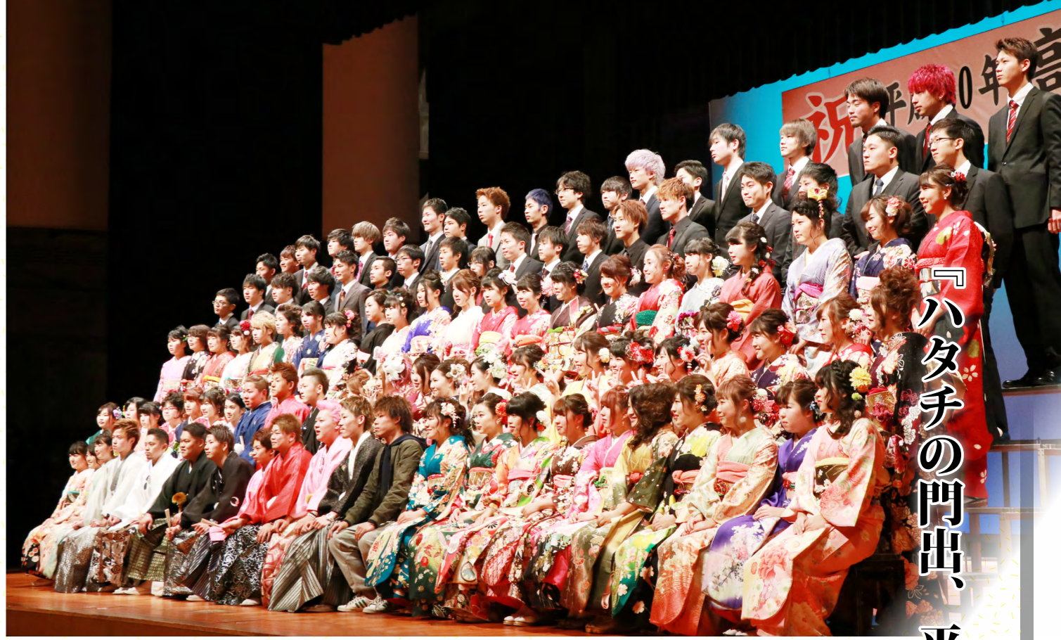
記念写真撮影のようす(安曇川地域)

1月7日(日)に高島市民会館で行われた成人式。407人の初々しい若者が集い、「おとな」としての決意を新たにしました。会場では、晴れ着姿の新成人が同級生や友人との再会を喜び合う光景が随所で見られました。