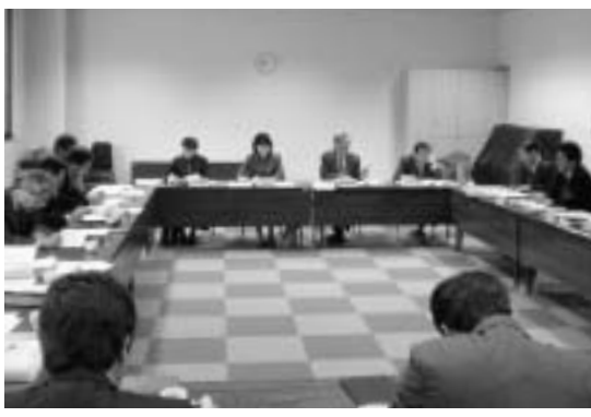
巡回教育委員会 朽木「やまびこ館」

今回の事業では、設計者を選ぶ方法として、設計額による「入札方式」や設計内容を競技する「コンペ方式」ではなく、施工主の想いをかなえられる最も適した設計者であるかどうかを判断する公募型の「プロポーザル方式」で行います。