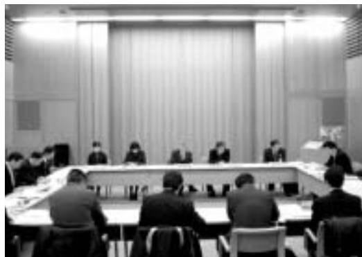
今津図書館で開催した定例教育委員会