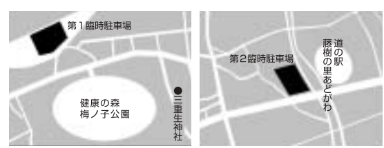
【第1臨時駐車場】 【第2臨時駐車場】