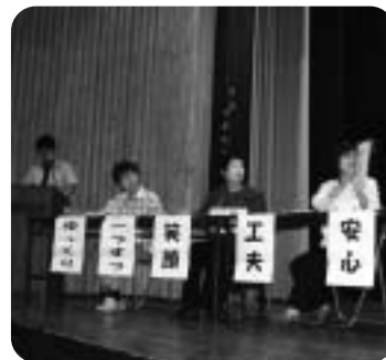
市役所職員研修 (キャラバン・メイト寸劇)