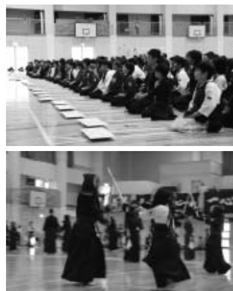
開会式では孝経の拝誦(写真上)が、試合には基本の習熟度を判定する基本判定試合(写真下)が盛り込まれるなど、藤樹先生の教えが活かされた大会となりました。