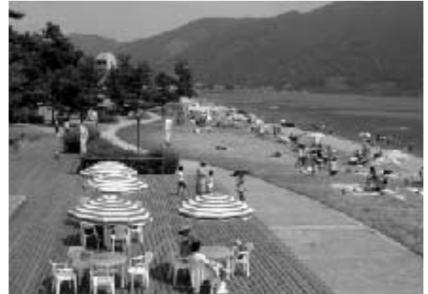
快水浴場百選に選ばれたマキノサニービーチ