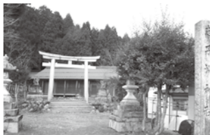
七シコブチのひとつ 「志子淵神社」(朽木岩瀬)

☎安曇川流域文化遺産活用推進協議会 ☎090(5014)1600 ☎文化財課 ☎(32) 4467