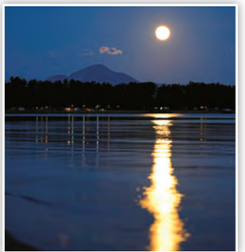
【湖面に輝く月光】 琵琶湖に映る月の光はきれいやな♪(たかP)