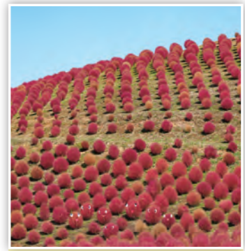
【コキアいっぱい】 よく見ると表情豊かなコキアを発見!(しまK)