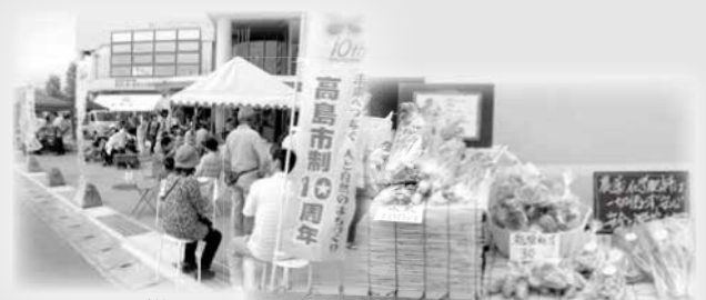
マルシェの様子 こだわりの商品をお届けします

高島市観光物産プラザ「たかしま・まるごと百貨店」では、毎週土曜日「たかしま・まるごと土曜マルシェ」を開催しています。新鮮なお野菜やお米、卵、鯖寿司など、地元のおいしさをまごころ込めて販売しています。皆さんのお越しをお待ちしています。