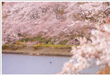
思うようにお出かけできない日々が続くけど、きれいな桜の写真で、おうちでお花見気分♪ たかP