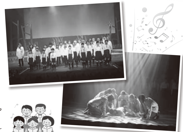
▲昨年12月上演の高島市市民劇のようす