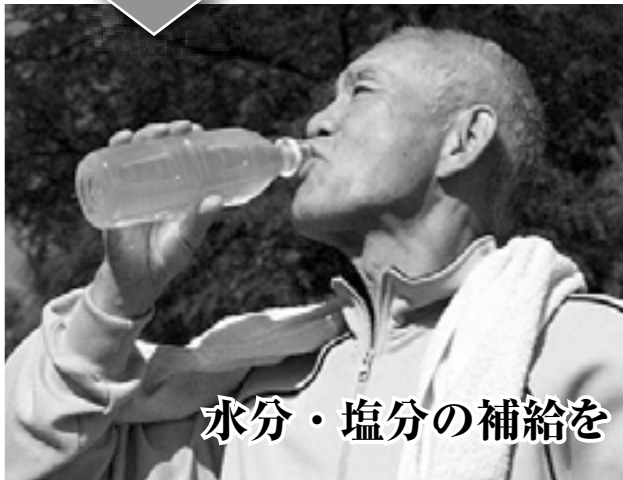
水分・塩分の補給を

熱中症とは、環境温度が皮膚温度より高く、多湿の状態に長時間さらされることであらわれる様々な体調不良をまとめていいます。筋肉のけいれん、倦怠感、頭痛、頻脈や尿量の減少など脱水が考えられる状態、意識障害などの中枢神経障害が見られた場合は速やかな対処が必要です。 手当の中心は「安静・冷却・水分補給」です。涼しい所やエアコンのある場所で安静を保ち、風通しを良くして塩分を含む水分を補給し、頭、首、わきの下、股関節を中心に冷やし冷水を噴霧したり扇風機を使用したりするのも有効です。症状が出た時、少しでも異変を感じた時は医療機関で受診しましょう。