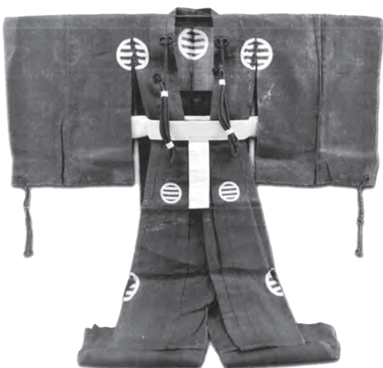
直垂 伝中江藤樹遺服(藤樹書院蔵)