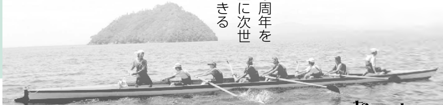
フィックス艇による周航