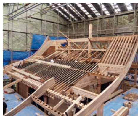
波爾布神社の修理のようす