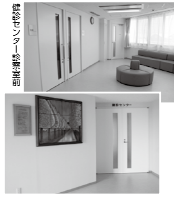
健診センター診察室前

これまで健診は、外来診察室等を使って一般診療と並行して実施してはきましたが、一部を除き大半の検査、診察をこの健診センターで行えるため、感染