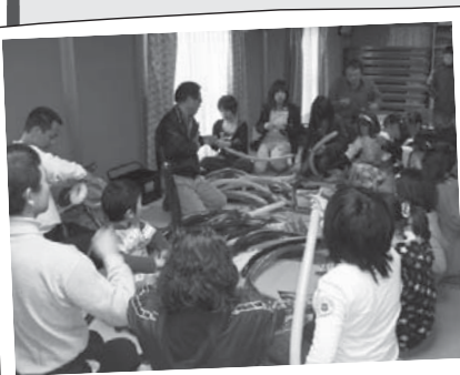
バルーンアートの指導

学校以外で子どもたちが集 まって、体験活動や物作りなど を行う機会が、子ども会行事や 地域活動等できくあります。そ うしたときに、「どんな内容な ら子どもたちのためになるの?」「作 りたいものはあるけれど、どう やって教えるの?」と疑問を 持った人は多いのではないで しょうか。 教育委員会では、子どもの体 験活動を推進するため、社会教 育課内に「子どもの体験活動サ ポーターバンク」を設置し、要 望や依頼に合わせて、子ども 活動の支援や指導を行うサポ ーターの紹介を行っています。ま た、体験活動の指導に必要な知 識や技術を学ぶ「子どもの体験 活動サポーター養成講座」を開 催し、登録者の増員をはかって います。