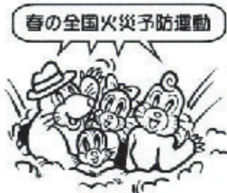
春の全国火災予防運動

火災が発生しやすい気候となる時季を迎えるに当たり、火災予防思想の一層の普及を図り、もって火災発生を防止し、高齢者等を中心とする死者の発生を減少させ、財産の損失を防ぐことを目的に、春の火災予防運動を実施します。