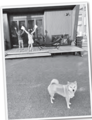
ワンちゃんも子どもたちと一緒に高島市の大自然を実感中！