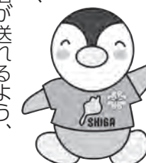
滋賀県民生委員・児童委員イメージキャラクター「びわっ湖ミンジー」

民生委員・児童委員、主任児童委員は、皆さんが住んでいる地域で安全安心な生活が送れるよう、地域住民の立場から支えるボランティアです。児童委員が行っている見守り活動の一例をご紹介します。