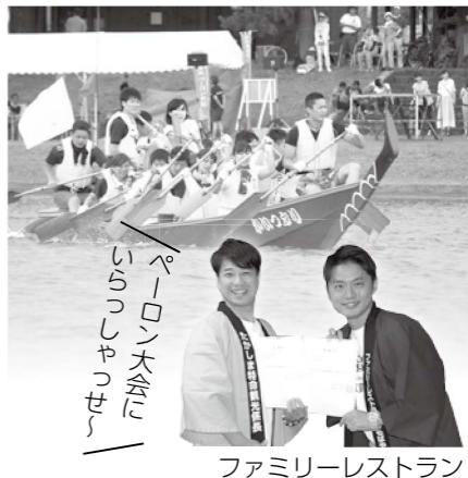
ペーロン大会にいらっしやせーファミリーレストラン

今年も高島の夏の風物詩「びわ湖高島ペーロン大会」を開催します。湖上に響くドラムの音と掛け声のもと、一斉に進む勇壮なレースをぜひお楽しみください。