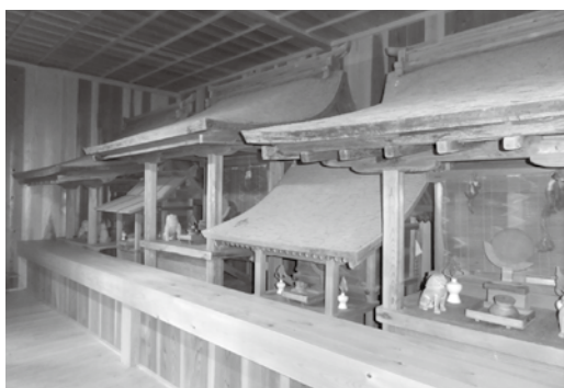
【写真】 思子淵神社 3棟 蔵王権現社(左奥)、本殿(中央)、熊野社(右手前)