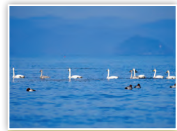
「白鳥の湖」 湖にコハクチョウが飛来しているようすやで! 気持ち良さそうに泳いでいるな! (しまK)