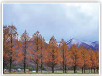
「雪山と紅葉の並木道」 中央分水嶺・高島トレイルの雪山とメタセコイア並木の紅葉のコラボレーションは見応えバッチリ! (たかP)

スマートフォンや携帯電話などからの応募も大歓迎! また、市ホームページではカラーで掲載!