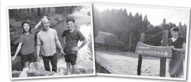
家族みんなで山でのびのび!