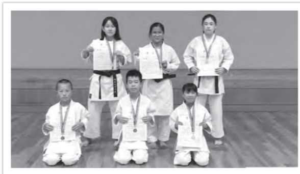
滋賀県スポーツ少年団空手道競技交流大会

また、本大会入賞者は11月23日（木）に京都府で行われた、第16回近畿ブロック空手道競技交流大会の出場権を獲得しました。（市民スポーツ課）