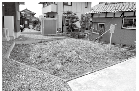
川原市の一里塚跡

一里塚とはその名のとおりの一里(約4km)ごとに置かれた塚で、古くから旅人の道しるべとなっており、人々の往来を見守ってきました。『高島郡誌』によれば、市内では、木津や海津など七か所に一里塚があったと伝わりますが、そのうち