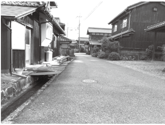
川原市宿場跡付近

高島市内の湖辺を南北にはしる西近江路は、古代より畿内と北陸を結ぶ主要街道でした。近世には北国海道とも呼ばれ、琵琶湖の湖上交通とも結びついて人や荷物が多く行きかい、宿場町が繁栄しました。滋賀県内にあった北国海道沿いの七宿のうち、高島市内にもマキノの海津宿、今津の今津宿、新旭の川原市の三宿がありました。