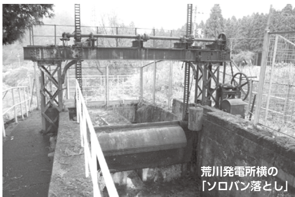
荒川発電所横の「ソロバン落とし」

を利用した水力発電所が設置され、電力会社は流筏路を作るなどして、筏流しが引き続き行えるように工夫をしました。荒川発電所では、筏が用水を取り入れる高岩堰堤から約1・1kmの水路のトンネルを通った後、安曇川へ合流するため、「ソロバン落とし」という装置のついた落差30mのス