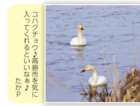
コハクチョウ♪高島市を気に入ってくれるといいなあ♪ たかP

スマートフォンや携帯電話などからの応募も大歓迎!また、市ホームページではカラーで掲載!