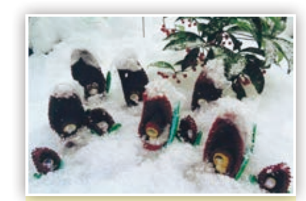
雪の日の庭に、手作りの座禅草人形を並べて春よこい♪ 頃常 芳子(今・今津)