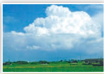
「夏の空」 真っ青な空にもくもくとした白い雲。 家の前で見た一瞬です。

スマートフォンや携帯電話などからの応募も大歓迎! また、市ホームページではカラーで掲載!