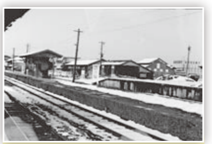
「江若鉄道の写真」 安曇川駅前東側の、手前が工場、右奥に滋賀相互銀行(今の関西みらい銀行)。

新型コロナウイルスの感染拡大防止のため中止や延期する場合がありますので、直前の情報をご確認ください。