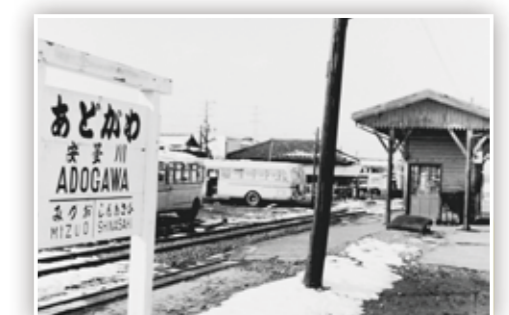
江若鉄道の写真 安曇川駅前の西側、路線バスの駐車場のようす。撮影/ 瀧田晃 投稿/ 瀧田俊一