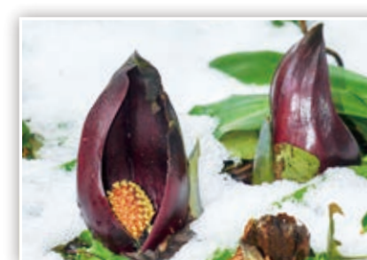
「ザゼンソウ群生地」 自ら発熱して、周囲の雪を溶かすザゼンソウ。雪の中からひょっこり出ているね♪

写真/イラスト/感想コーナー 広報誌に写真・イラストを掲載しませんか? 広報誌への感想をお聞かせください。 スマートフォンや携帯電話などからの応募も大歓迎!また、市ホームページではカラーで掲載!