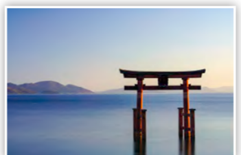
おうみしらひげだい 「藍湖白鬚台」 白鬚神社にある湖中大鳥居 を撮影できる展望台「藍湖 白鬚台」からパシャリ。高 台になっているので鳥居が バッチリ見えるやろ!

スマートフォンや携帯電 話などからの応募も大歓迎! また、市ホームページではカラーで掲載!