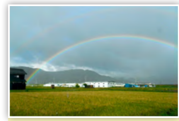
「虹」 早朝に家の裏で見た瞬間。二重に虹が映えて感動しました。 ぜひカラー版もチェックしてください。

新型コロナウイルスの感染拡大防止のため中止や延期する場合がありますので、直前の情報をご確認ください。