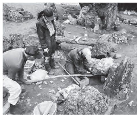
旧秀隣寺庭園修理の様子

「朽木地域の歴史遺産」をテーマに、県内で文化財調査に従事する研究者による講義と現地解説を交えながら、学んでいただく全4回の連続講座です。 問 市内に在住、在勤、在学の方 定 各回先着20人 費 200円/回 ▼募集期間 8月1日(月)～9月2日(金)