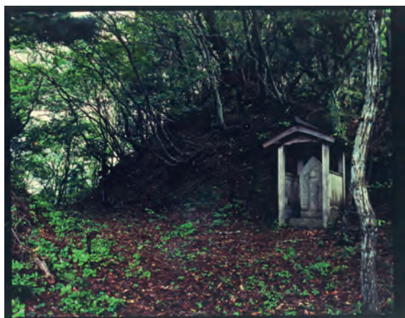
入部谷峠の馬頭観音

そして明治15(1882)年に琵琶湖に太湖汽船が就航し、大溝港からの湖上交通(蒸気船)が利用できるようになります。朽木から入部谷を越えて、大溝港から大津・京都への行楽や修学旅行、伊勢神宮の参拝などに行く人が多くなりました。