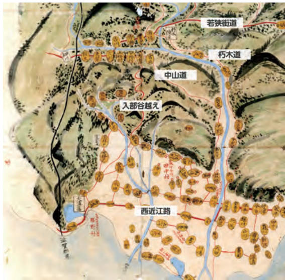
高島郡村絵図(一部・文化財課で加工)

りませんが、明治11(1878)年にまとめられた『滋賀県物産史』によると朽木村で生産された木炭の約34%が勝野に運ばれています。炭を運び終えた朽木の人は、大溝で日常生活に必要な物資を調達し朽木に帰っていました。また白鬚神社のなるこ参りや嶽観音の千日参りに行くにもこの道を使っていたといわれています。入部谷峠の東側の麓である武曾には、休憩場所として茶店・旅籠(宿)などが並んでいたといわれています。