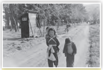
「道③ 萩の浜」 まだ白浜水泳場がなかった頃で、萩の浜あたりの湖岸道路と思われる道を歩く子守をする女の子。

スマートフォンや携帯電話などからの応募も大歓迎! また、市ホームページではカラーで掲載!