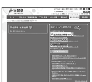
滋賀県ホームページ「防災ポータル」