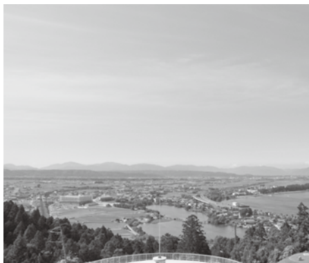
琵琶湖と乙女ヶ池(遠景)