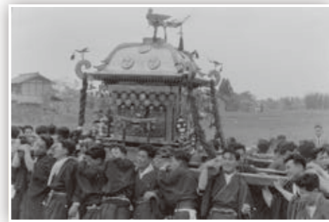
深溝の日吉二宮神社の祭りだと思いません。神輿の家紋(屋根紋)みたいなものは、社紋といって、これは左三つ巴。